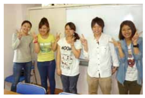
新人職員研修の様子